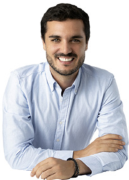
Alejandro Navarro Prieto Alcalde

No hay nada mejor que empezar el 2025 dando el primer paso para hacer realidad esos ya habituales buenos propósitos de año nuevo. Ese primer paso, no es otro, que consultar esta completa guía de cursos y talleres que tienes entre tus manos donde hay una amplia variedad de iniciativas para hacer realidad esos objetivos, ya sea mantenerte en forma, ampliar conocimientos o simplemente consultar qué actividades se realizan desde el Ayuntamiento adaptadas a tu edad y gustos personales. Por supuesto, que, para cumplir tus buenos propósitos, tu iniciativa debe ir más allá de consultar esta publicación; hay que dar ese paso más e inscribirte. Desde aquí te animo a ello.