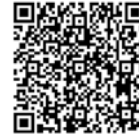
Código QR para inscripción talleres C. Igualdad