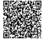
Código QR para inscripción talleres C. Igualdad en FAMILIA